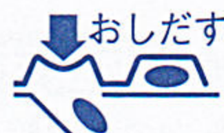
(PTPシートの取り出し図)